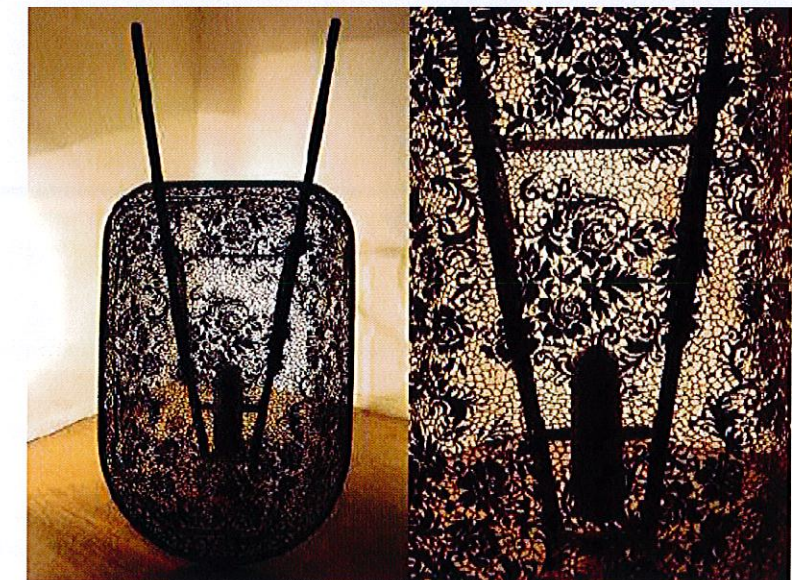
L Cal Lane, brouette en métal découpé