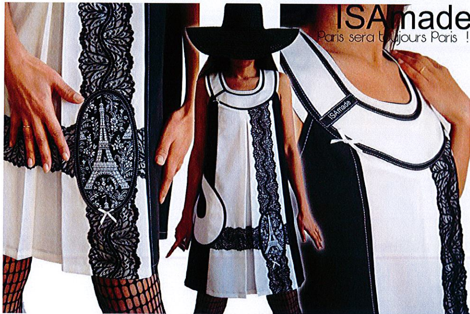
A : ISAmade, robe trapèze, applications de dentelle