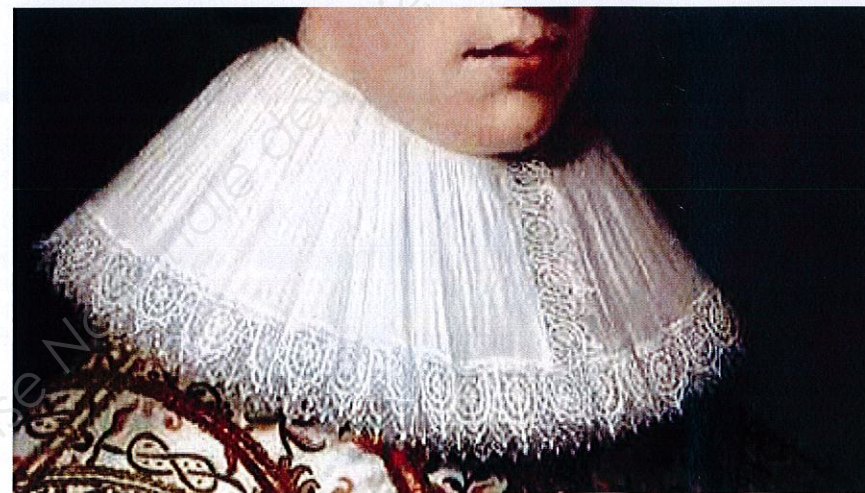
K Portrait d'homme, détail du costume