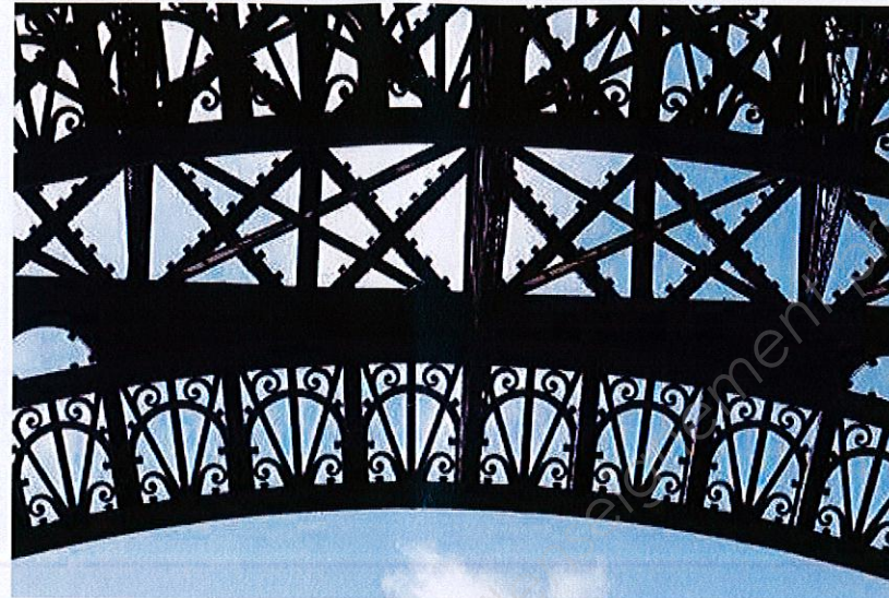
B : Tour Eiffel, structure en fer pudlé, rivetée et boulonnée