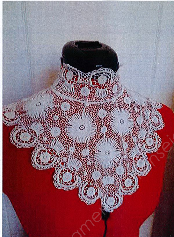
H Détail d'un costume féminin