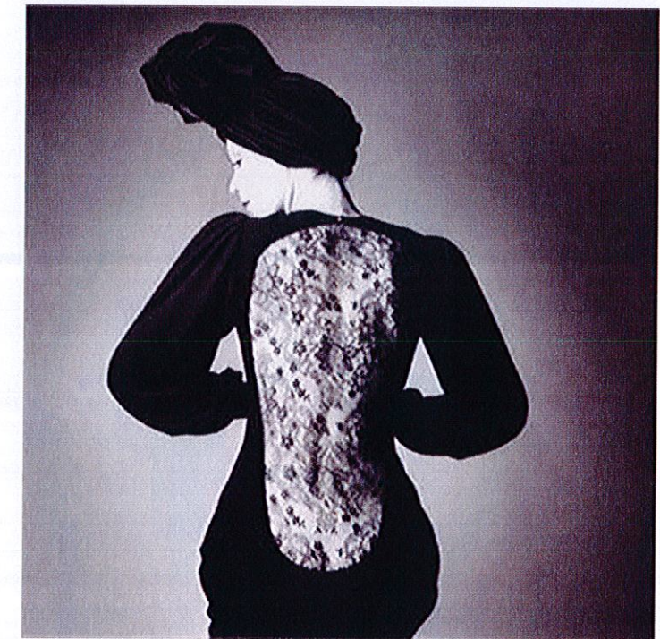
F Yves Saint Laurent, robe noire, dos dentelle mécanique incrustée