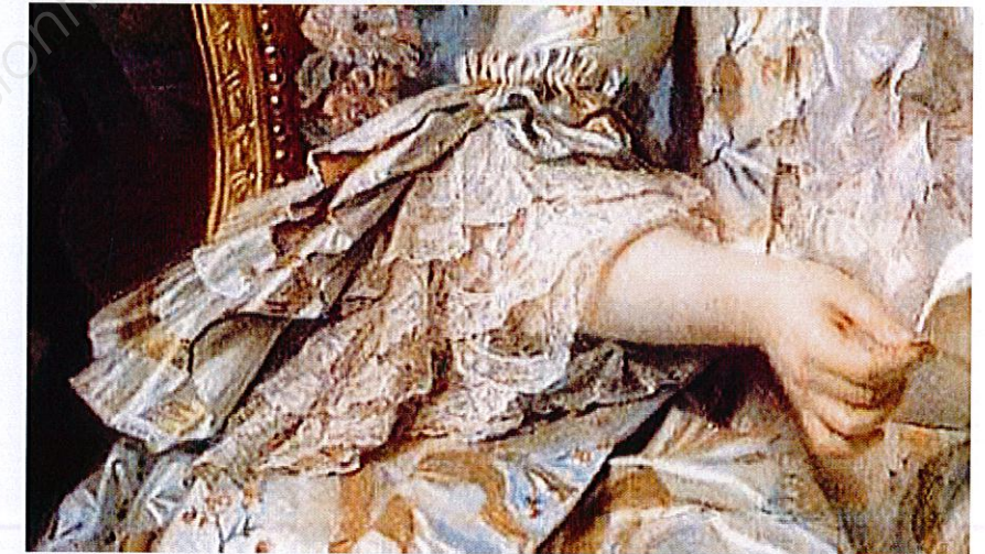
C : Portrait de Madame de Pompadour, détail du costume