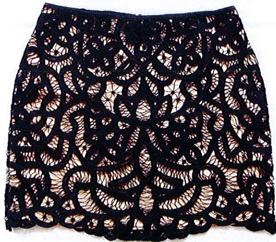
J The Kooples Jupe dentelle mécanique