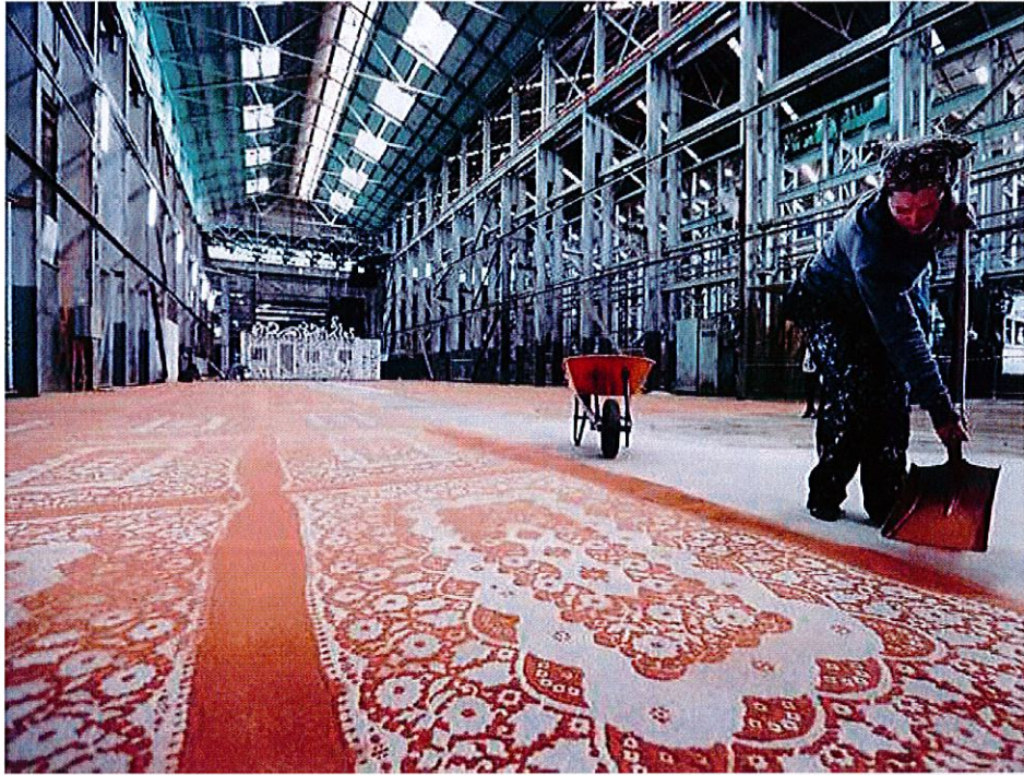
G Cal Lane, installation au sol, dentelle éphémère