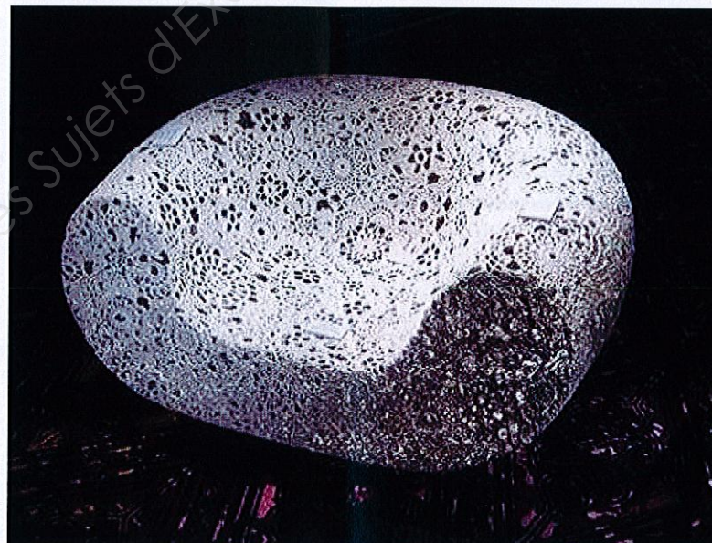
E Marcel Wanders : Fauteuil en fibre de carbone, coton et résine époxy