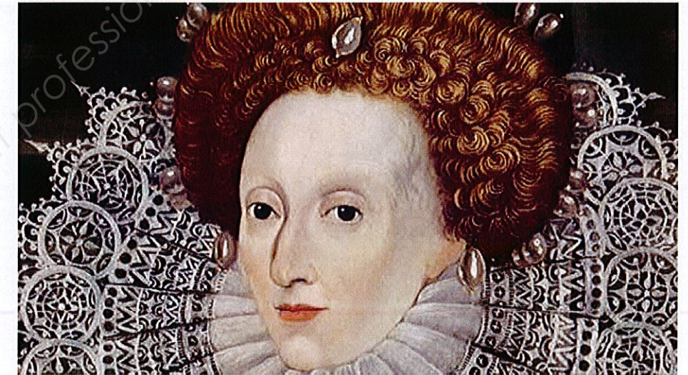
I Portrait d'Elisabeth 1 ère , détail du costume